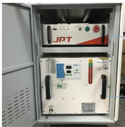
JPT fiber laser source